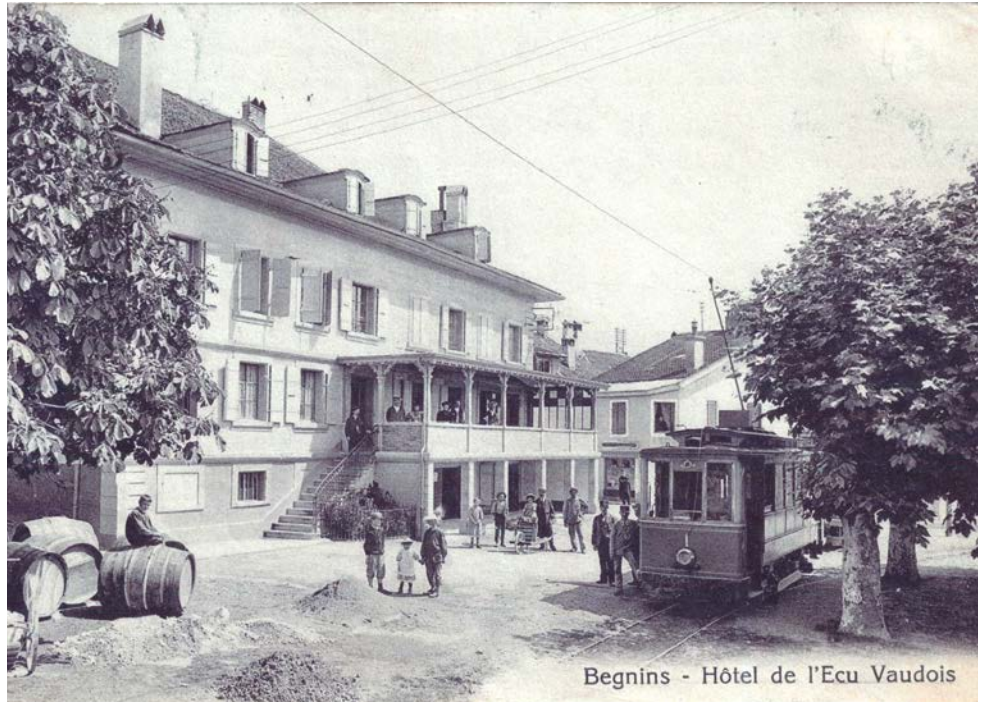
Tram à Begnins, vers 1910

Un passager habituel raconte: «C'était un véhicule pittoresque, convivial et attachant, un peu grinçant et brinquebalant. Les deux banquettes qui se faisaient face favorisaient une conversation générale. Quand on avait raté le départ, on pouvait le rattraper au contour suivant, au grand dam des conducteurs. Les collégiens qu'il véhiculait quotidiennement, s'asseyaient sur les marchepieds et jouaient à arracher au passage les fleurs des talus.»