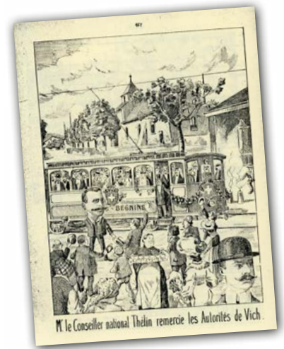
L'inauguration du Gland-Begnins, caricature tirée du journal humoristique Guguss' du 23.06.1906