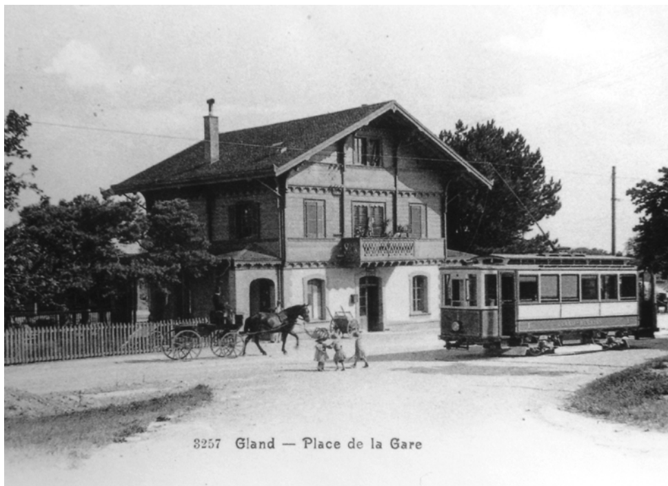
Tram à la gare de Gland, 1906

Des obstacles retardent toutefois le début des travaux, nécessitant quatre demandes de prolongation de la concession, la dernière étant accordée en 1902.