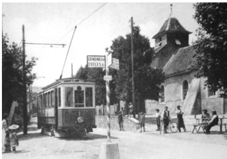
Tram à Vich, 1906

Les voitures sont décorées pour l'occasion et un écriteau «Le travail fut sa vie. Sa peine est finie. Dors en paix chérie» est placé à l'avant. La dernière course, émouvante, est ponctuée d'arrêts, des bouteilles de vin du pays étant déposées le long de la voie.