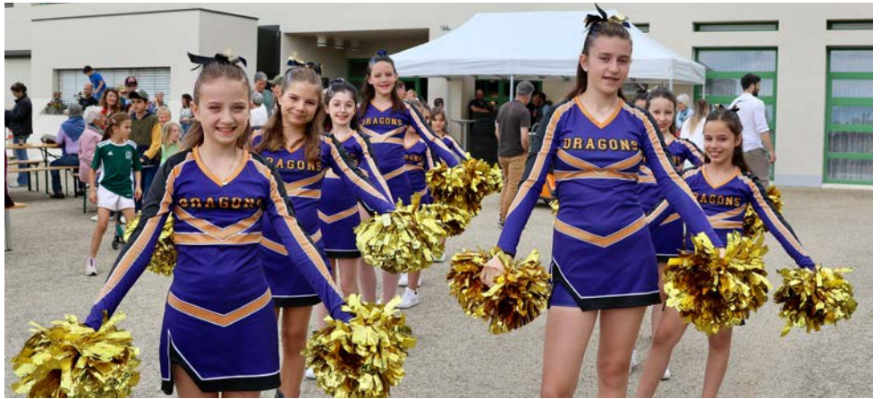
Les Dragons Cheerleaders animent divers événements sportifs dans toute la région.

Pour la petite histoire, l'ancêtre du cheerleading est apparu au XIXe siècle aux Etats-Unis. A l'époque, l'idée était d'encourager les équipes en canalisant positivement l'énergie des spectateurs lors d'événements sportifs. Peu à peu, les formations ont ajouté des mouvements acrobatiques sur de la musique dynamique. Au fil du temps, des éléments plus techniques, tels que de la gymnastique au sol (tumbling), des enchaînement de portés (stunts), des sauts (jumps) et des pyramides, sont devenus des incontournables lors d'une prestation. A l'origine, les équipes étaient exclusivement formées d'hommes. Aujourd'hui, les femmes représentent 90% des athlètes.