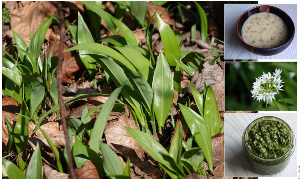
Ci-dessus: Les feuilles de l'ail des ours sont brillantes dessus, mates dessous. Leur nervure principale est proéminente. Ci-contre: Un petit pot de pesto, des fleurs en forme bien reconnaissable d'étoile et un bol de soupe.

Chaque printemps, les forêts de feuillus se parent de magnifiques tapis d'allium ursinum qu'on nomme aussi ail sauvage, ail des bois, ail pétiolé ou ail à larges feuilles. Vous