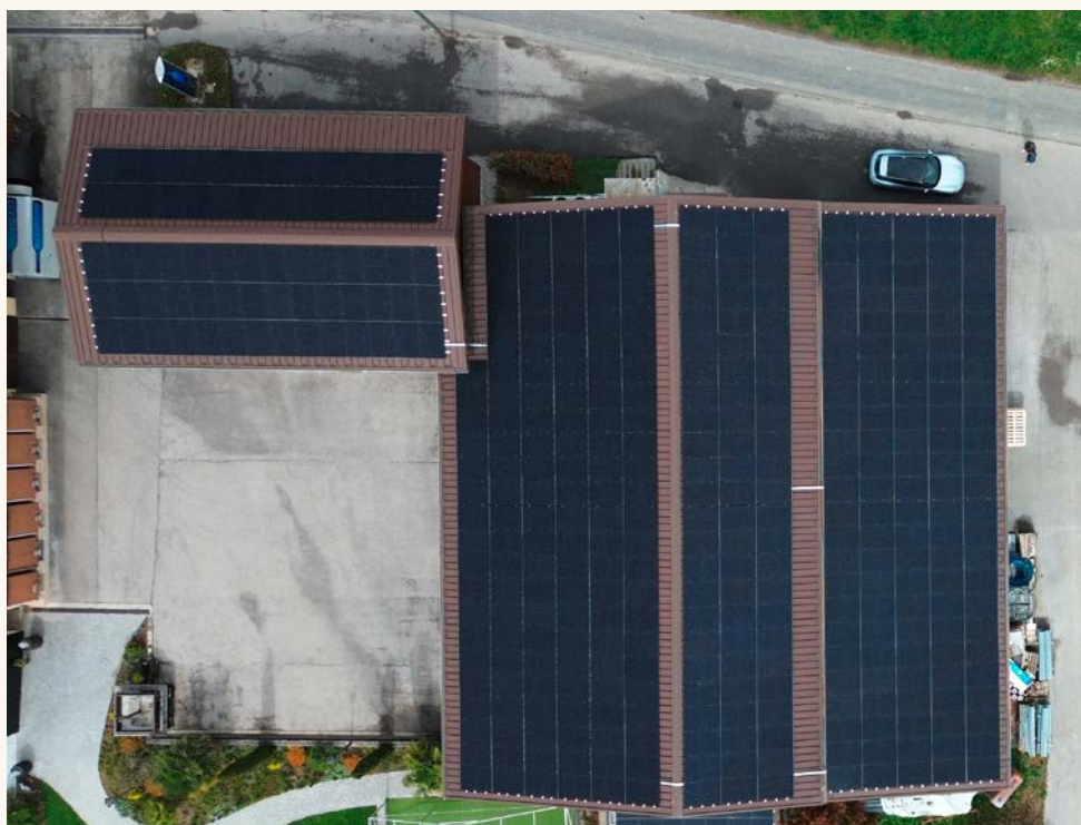
Une des dernières réalisations : Plus de 800m 2 de panneaux Photovoltaïques à Gland. Au Domaine de la Capitaine

De récentes dispositions légales (RCP) permettent aux Propriétés Par Etage de rentabiliser plus facilement ces investissements.